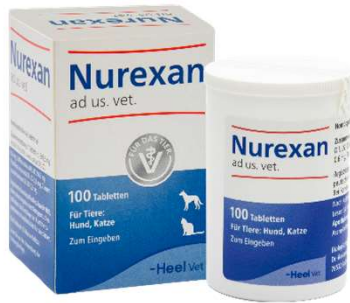
NUREXAN 100 TAB (VEN. 09-2029)