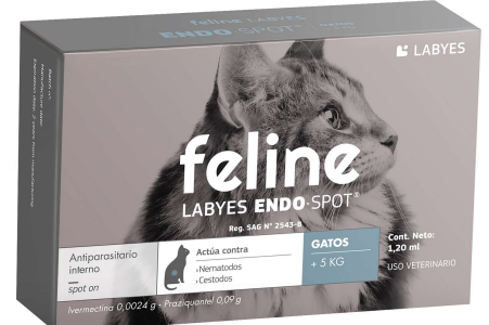
FELINE LABYES ENDO +5 KG (VEN. 02-2025)