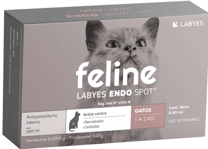
FELINE LABYES ENDO 1-2KG (VEN. 02-2025)