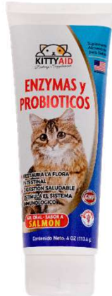
KITTYAID ENZYMAS Y PROBIÓTICOS