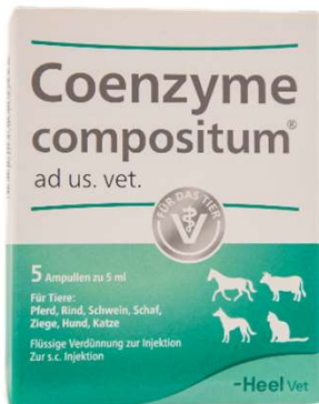
COENZYME COMPOSITUM X 5 AMP (VEN. 04-2028)