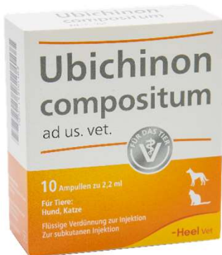
UBICHINON COMPOSITUM (VEN. 04-2028)