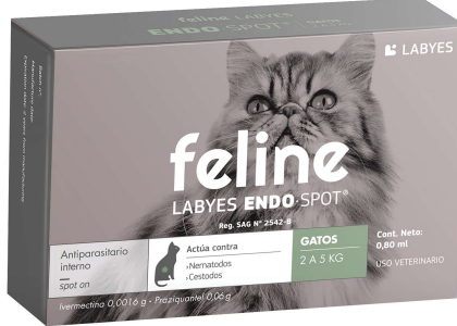
FELINE LABYES ENDO 2-5 KG (VEN. 02-2025)