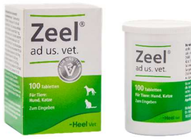
ZEEL 100 TAB (VEN. 06-2028)