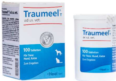
TRAUMEEL 100 TAB (VEN. 04-2028)