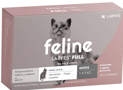
FELINE LABYES FULL 1-2KG (VEN. 04-2025)