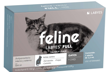
FELINE LABYES FULL +5 KG (VEN. 08-2025)