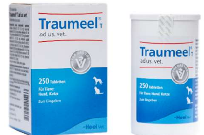
TRAUMEEL 250 TAB (VEN. 06-2027)