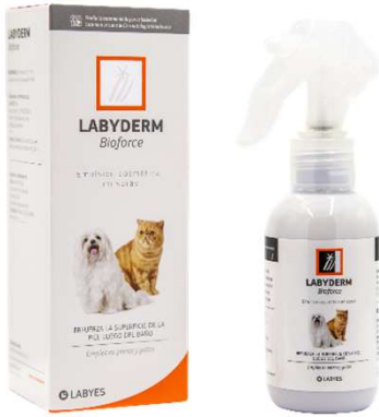
LABYDERM BIOFORCE SPRAY (VEN. 09-2025)