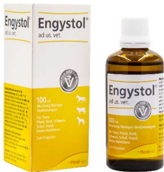
ENGYSTOL GOTAS 100 mL (VEN. 06-2028)