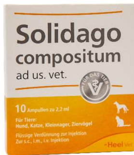
SOLIDAGO COMPOSITUM X 10 AMP (VEN. 04-2028)