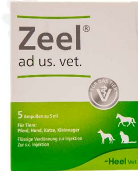
ZEEL X 5 AMP (VEN. 08-2026)