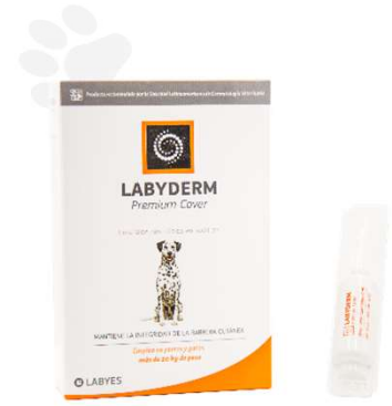
PREMIUM COVER 4 ML (VEN. 06-2025)