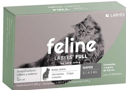
FELINE LABYES FULL 2-5 KG (VEN. 02-2026)