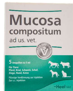
MUCOSA COMPOSITUM X 5 AMP (VEN. 04-2028)