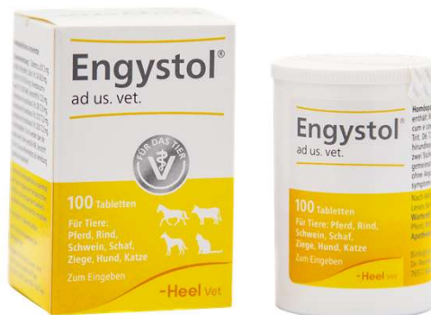
ENGYSTOL X 100 TAB Llega primera semana de julio

Lote: 99145-99049 / SKU: V100382-V100383