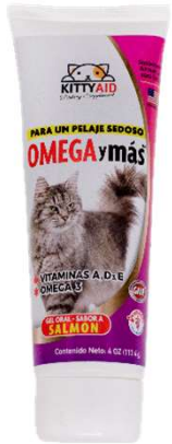
KITTYAID OMEGAS Y MÁS

El más completo y variado kit de suplementos para gatos.