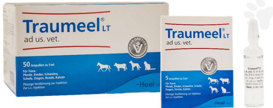
TRAUMEEL X 5 Y 50 AMP (VEN. 06-2027)