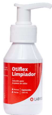
OTIFLEX 100 ML