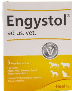
ENGYSTOL X 5 AMP (VEN. 09-2027)