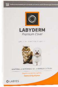
PREMIUM COVER 2ML (VEN. 09-2025)